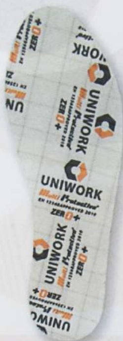
Lamina ARMATEAK 0+