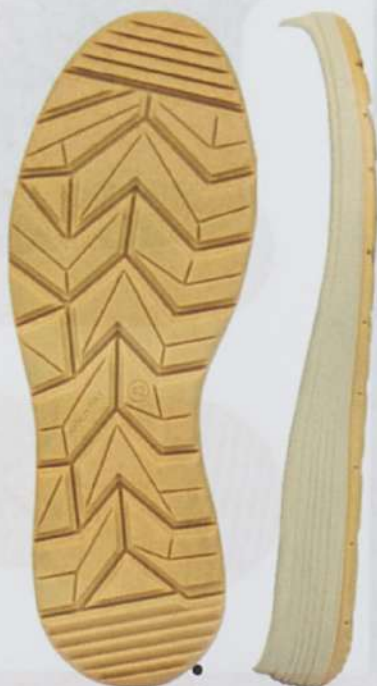
Suola URBAN Poliuretano Bidensità SRC